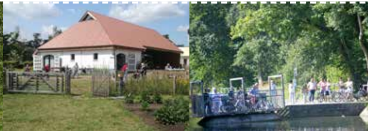
Overzet De Liereman - Ravelse bossen